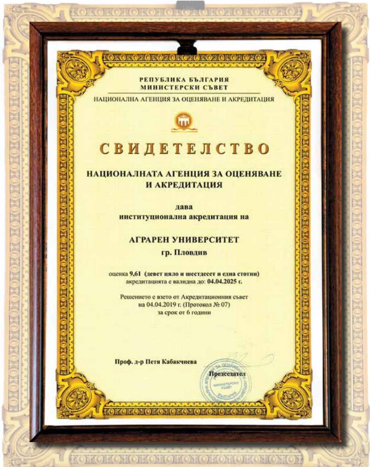
Certificate issued by the National Evaluation and Accreditation Agency of the Republic of Bulgaria for Institutional accreditation of the Agricultural University – Plovdiv, granted on 04.04.2019 for a period of 6 years, valid until: 04.04.2025, rating: 9.61 (nine point sixty-one).