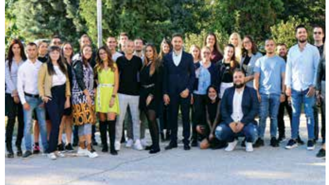
Колоритът на студентската общност в традиционния студентски форум „Аграрен университет – букет от националности“

The color of student community in the traditional student forum “Agricultural University – a Bouquet of Nationalities”