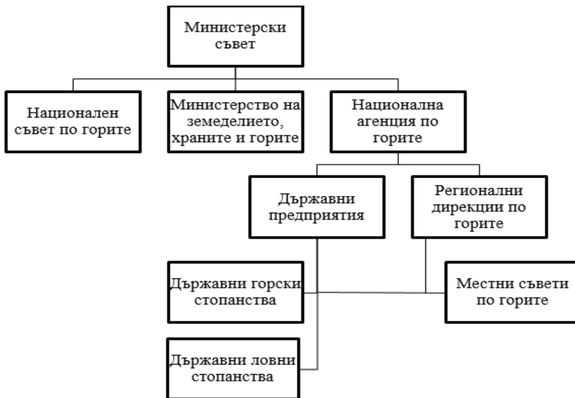
Фигура. Нова институционална структура на управление на държавните предприятия

За подобряване на процеса на управление и вземане на стратегически решения, е предложено създаване на Местни съвети по горите, които да включват представители на заинтересованите страни на локално ниво. Такива могат да бъдат: представителни на НПО, обществеността, представители на местните власти, регионалните дирекции по горите, регионалните инспекции по околна среда и др. Чрез тези местни съвети ще могат да се отчитат специфичните проблеми на съответните горски райони, местни традиции и регионални икономики. Всичко това дава възможност за вземане на ефективни решения в посока подобряване на състоянието на горите и тяхното многофункционално стопанисване, отчитайки местната бизнес среда и ползите за местните общности. Това ще позволи вземането на решения да е в посока „отдолу – нагоре“, като това дава възможност за по-добро отчитане на проблемите и предлагането на решения от хора по-близо да самия проблем, което ще доведе до подобряване на стратегическото управление на ДП, ДГС и ДЛС и съобразяване с териториалните особености.